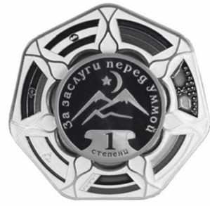
ОРДЕН «ЗА ЗАСЛУГИ ПЕРЕД УММОЙ» 1 СТЕПЕНИ

...и скрывает что эта газета должна быть 4.05.2004. А.-Х. Кадыров