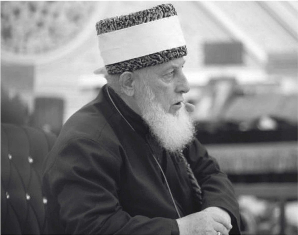
Мардех куыг кхетча, ламаз духий?

Несан мардех куыг кхетча, ламаз духуш дац, дай, йопий ларало и шь шарилатехь, хлунда аьлча, клентан хилла зуда цкъа а йалон мегаш дац дас, ден долахь хилла йолу зуда кланта йалон а мегаш дац.