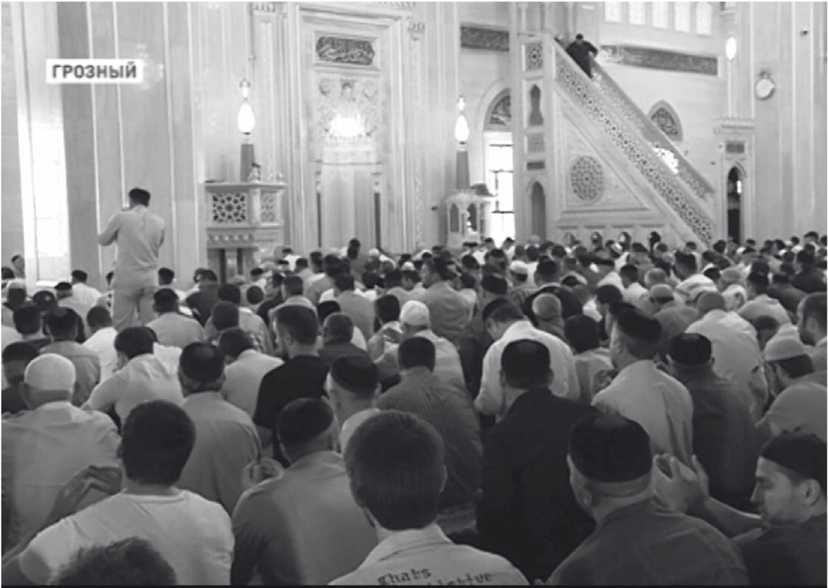
Сурт до лчохь ламаз дан мегар дуй?

Ламаз карахь доцуш вуй ма-хьи, кхидла ламаз дац цуьнан. Ша моьларе хлосттина велахь, чехкка моьларера длавала веза, ткъа имам хил-ла, нахана хьалха хлосттина велахь, меллаша «сан ламаз карахь ца хилла, шу цхъаь хьалхавала» аьлла, цхъаь-ннан цле а йаьккхина, длавала веза, йуха сихха ламаз карла