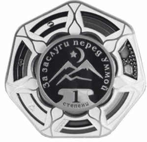
ОРДЕН «ЗА ЗАСЛУГИ ПЕРЕД УММОЙ» 1 СТЕПЕНИ