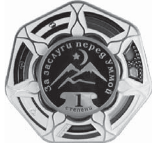
ОРДЕН «ЗА ЗАСЛУГИ ПЕРЕД УММОЙ» 1 СТЕПЕНИ

...и слышно ...и слышно ...и слышно 4.05.2004 А.Х. Кадиров