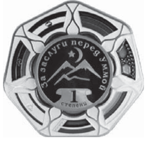
ОРДЕН «ЗА ЗАСПУГИ ПЕРЕД УММОЙ» 1 СТЕПЕНИ