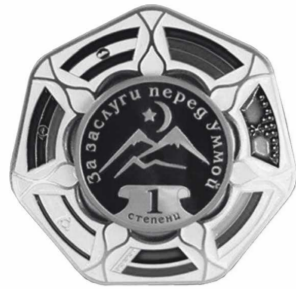
ОРДЕН «ЗА ЗАСЛУГИ ПЕРЕД УММОЙ» 1 СТЕПЕНИ