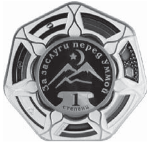
ОРДЕН «ЗА ЗАСЛУГИ ПЕРЕД УММОЙ» 1 СТЕПЕНИ

...и скажу что эта газета действительно была 4.05.2004 А.-Х. Кадыров