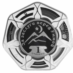
ОРДЕН «ЗА ЗАСЛУГИ ПЕРЕД УММОЙ» 1 СТЕПЕНИ

...и Сидра 24-я эта газета уполномочена быть 4.05.2004. А.-Х. Кадыров