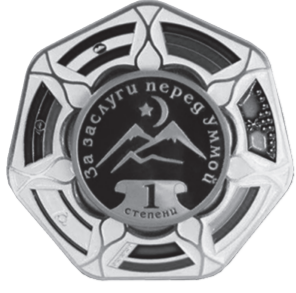
ОРДЕН «ЗА ЗАСЛУГИ ПЕРЕД УММОЙ» 1 СТЕПЕНИ

...и Сидра 2-я эта газета должна быть 4.05.2004. А.-Х. Кадыров