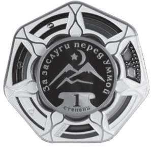
ОРДЕН «ЗА ЗАСЛУГИ ПЕРЕД УММОЙ» 1 СТЕПЕНИ

...и Смерть эти эта газета должна быть 4.05.2004. А.-Х. Кадыров