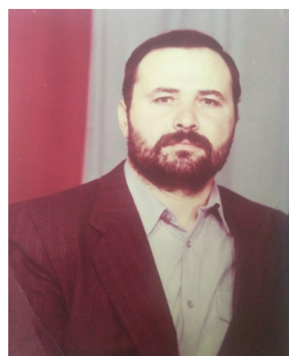
«Исламан зъанарш» (Зори Ислама) газет ша арадала доладелчакхана, нах кхеташ, бусалба дин царна марздеш,

хаздеш, тIарикъатан некъаш довьуйтуш, эвлыйин белхаш бовзуйтуш, Везачу Делан Къуръанан нур хилла дIахIоьттина, вайн Даймакхана доккха совIгIат ду иза. Бусалба дин дело маьрша доцуш, коммунистийн Iедал коьртгехь долчу хенахь вайн махкахь бусалба динан нур къагош, мохк серлабоккхуш кхетта Ислам динан зъанарш, тахана а вайн махкахь бусалба динан серло хилла лаятташ ю. Дерриг диканиг, беркатениг, Кхьоллинчу АллахаIна вай мелла а гергакхочош дерг, дуйненна а, эхартана а пайденниг хьоху вайна «Исламан зъанарша».