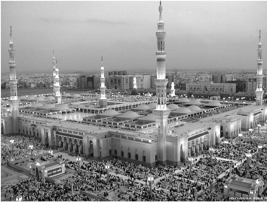
← 01 Тлакха Элчано (Делера салам-маршалла хуьлда цунна) аьлла: «Цара эрриг ах а ала, тлакха хьо вьалча, деха – лур ду хьуна».

(Абу Давуд, ан-Насаи) Лекха волчу Аллахе деха, ах дехнар Цо лур ду хьуна бохург ду иза.